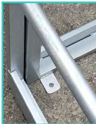
固定用ピース 穴径φ13