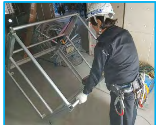
φ75キャスター付き 一人で移動できます。