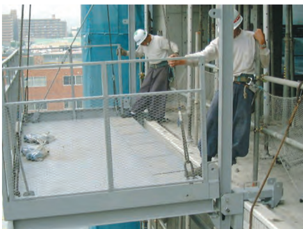
5. 建地レールに付属するピンにステージを合せて仮置きする。