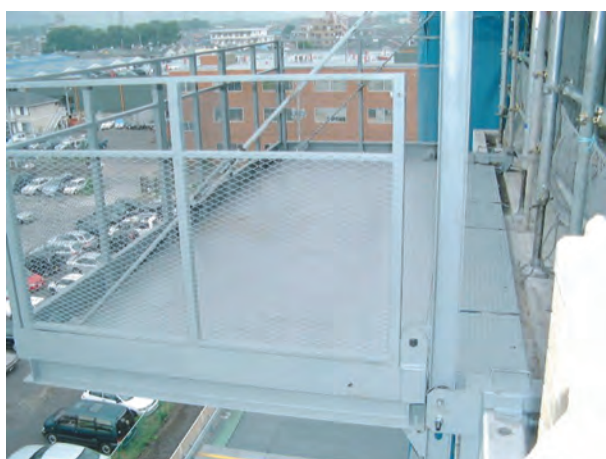
8. ターンバックルを調整して完了。