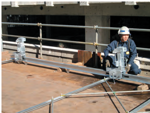
2. 建地レールにブラケットをセットする。