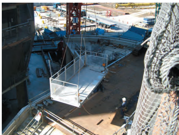
4. ステージに羽子板ボルトと手摺を固定した後に、ステージを吊り上げてユニットの方向へ移動する。