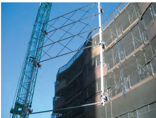
3. ユニットを建物に取付ける。