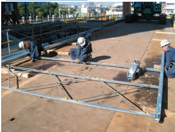
1. 建地レールを並べて布地アングルをボルトで固定し、プレスをとめる。