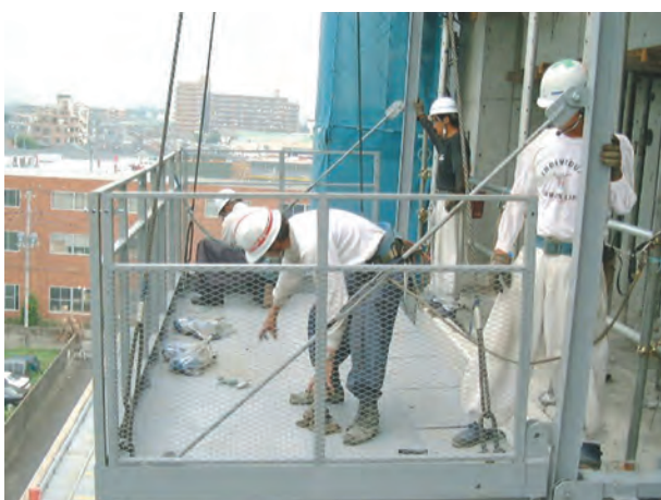
7. 建地レールに付属するピースとステージのピースをボルトにて固定する。