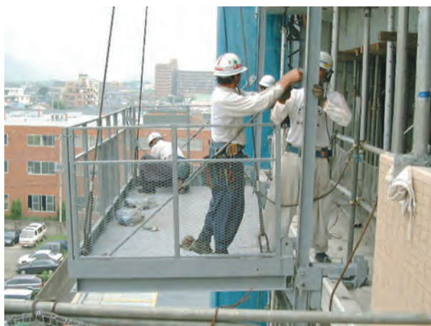
6. 羽子板ボルトを取り付ける。